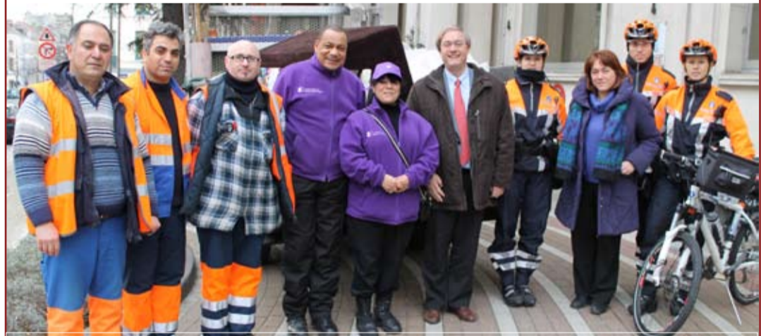
Les membres de la Brigade, accompagnés du Bourgmestre et de l'Echevine des Travaux publics.