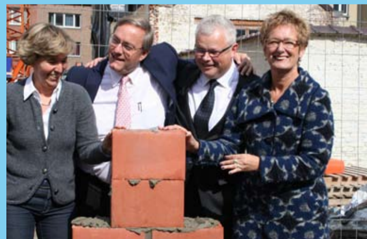
Une première pierre posée dans la bonne humeur par les autorités communales et régionales, accompagnées par la présidente de Constellations.

Quant au site choisi, c'est celui de l'ancien orphelinat St-Joseph. La démolition des vieux bâtiments s'est achevée en mai. On en est donc aujourd'hui à la phase de construction et deux nouveaux immeubles vont sortir de terre dans les mois à venir . Le premier abritera en intérieur d'ilôt un centre d'accueil